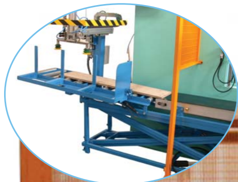
Dettaglio CARICO TAVOLE - Detalle CARGA TABLA LOADING TABLES Detail - Détaille CHARGEMENT TABLES